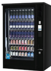
G-DRINK 9 OUTDOOR TOUCH DT9 OD