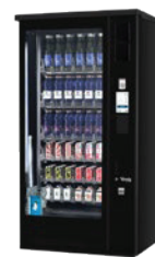
G-DRINK 6 OUTDOOR TOUCH DT6 OD