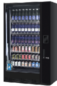
G-DRINK 9 Slave DS9-B