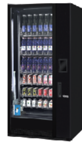
G-DRINK 6 Slave DS6-B