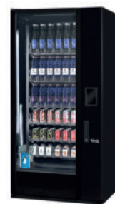
G-DRINK 6 Slave DS6-B