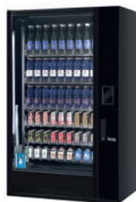
G-DRINK 9 Slave DS9-B